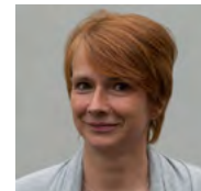
Kindergarten Susanne Daum

Markgrafenstr. 123 0177-850 34 43 s.burow@pg-dortmund.de Di - Fr 09.00-16.00 Uhr